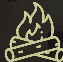
CHIMENEA AL AIRE LIBRE